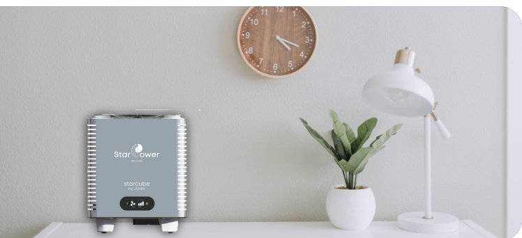
A casa e in ufficio

È considerato il processo più sicuro ed efficace per scomporre le sostanze inquinanti.