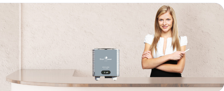
Hotel e Spa