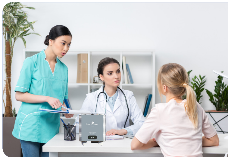
Strutture ospedaliere e sanitarie

STARCUBE è disponibile in acciaio AISI 304 ed è personalizzabile nella parte superiore dove poter inserire il proprio logo, diventando così un oggetto estremamente versatile e facilmente integrabile ai diversi ambienti nei quali viene collocato. Questo acciaio ci garantisce ottima resistenza alla corrosione, facilità di ripulitura e ottimo coefficiente igienico.